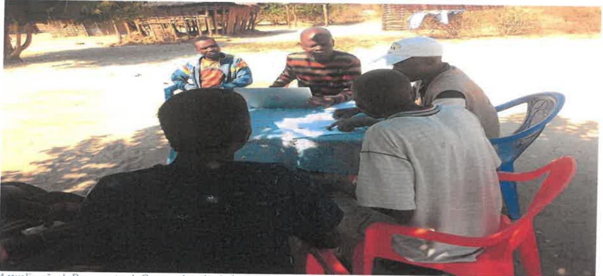
Actualização de Documentos de Cooperativas Agrícolas no processo de legalização das suas estruturas administrativas e terras/nos Bundas.

Anexe comprovativos da realização das actividades, que podem ser imagens, listas de presenças ou outros documentos que achem necessário. Sempre legendar os anexos. Máximo 10 anexos.