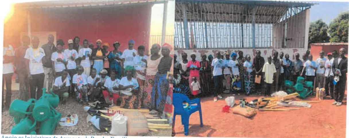
Apoio as Iniciativas de Aumento de Rendas Familiares com os Imputes e Sementes Horticolas aos SACs de aldeias d Caxita-Itengo/Saurimo