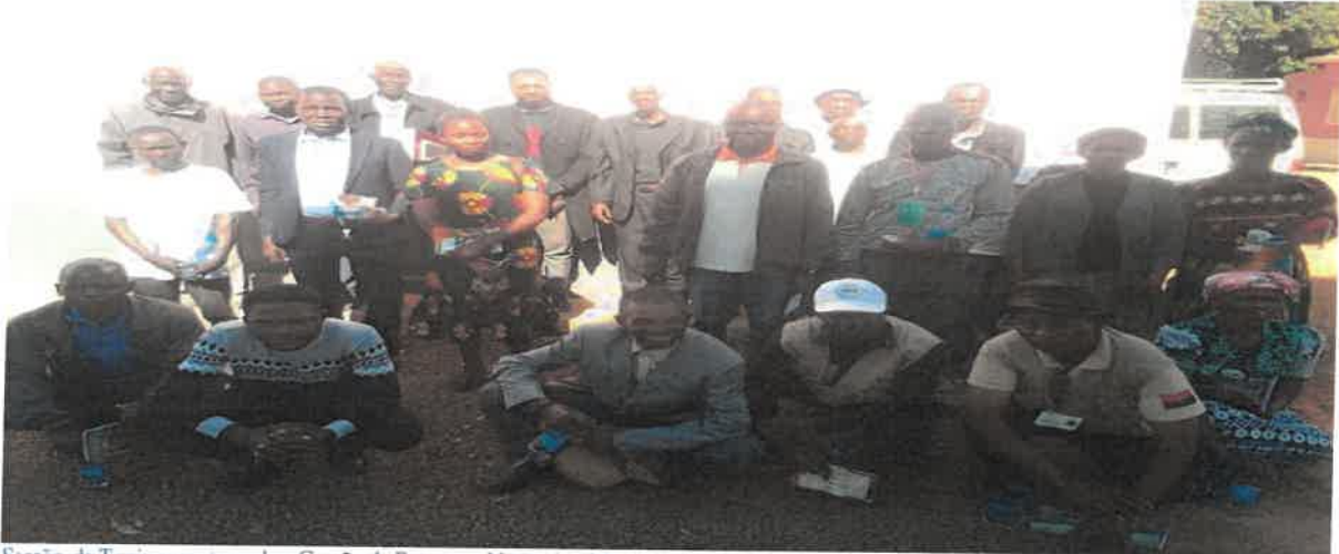
Sessão de Treinamentos sobre Gestão de Recursos Naturais e Meio Ambiente /nos Bundas