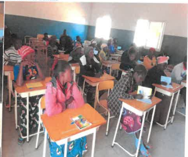
Sessões de Treinamentos com membros de CDAs das aldeias de Luconha e Luzi/no município de Luchazes/Gest. Recursos Nat e Meio Amb