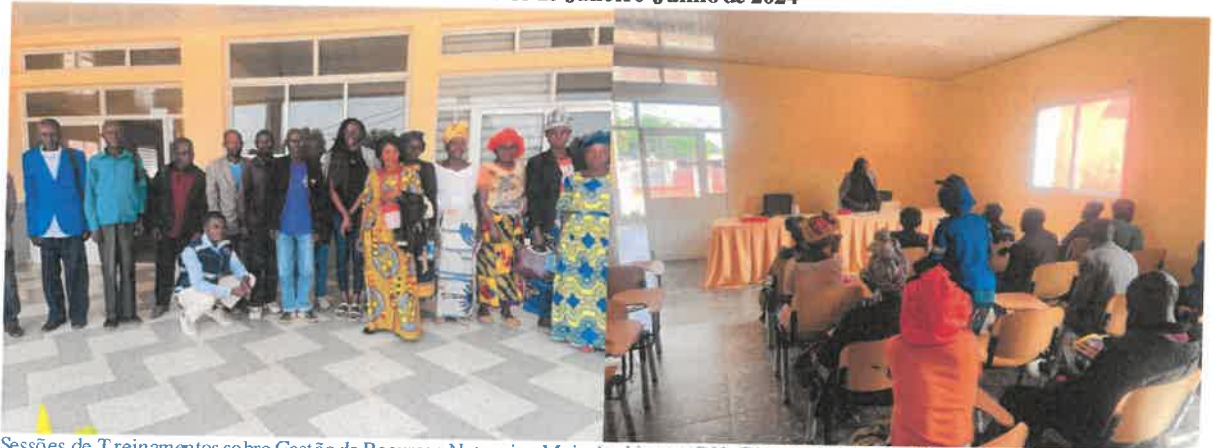
Sessões de Treinamentos sobre Gestão de Recursos Naturais e Meio Ambiente e DH, Género e Violências Domésticas/Saurimo